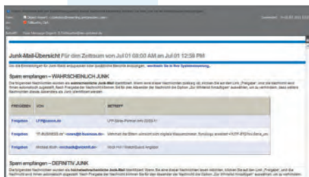
Zur Senkung der „Wrong-false“-Quote bekommen Nutzer individuelle Mailreports