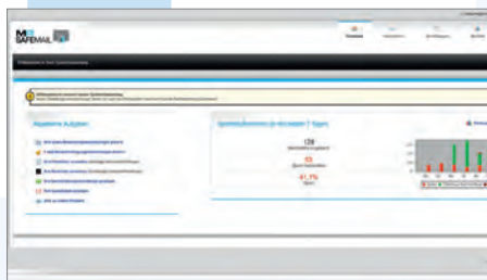
Ein übersichtliches, deutschsprachiges Portal bietet Zugriff auf Einstellungen